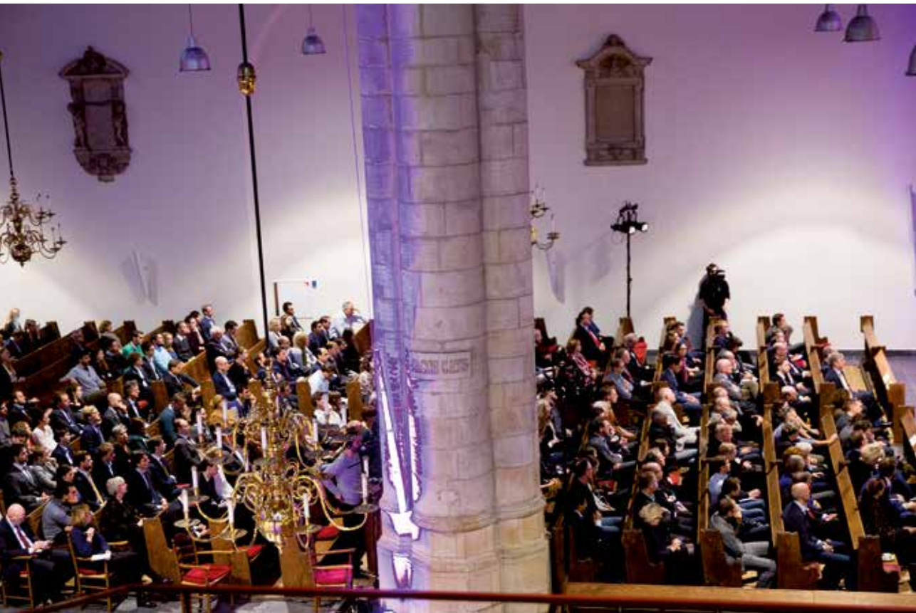
Rob-lezing 2015.

Op initiatief van de Tweede Kamer heeft minister Plasterk van Binnenlandse Zaken en Koninkrijksrelaties de Raad voor het openbaar bestuur gevraagd te adviseren over de democratische legitimiteit van samenwerkingsverbanden.