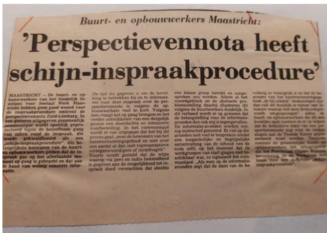
Krantenknipsel Perspectievennota 1-03-1979 65

De kop van het Limburgs Dagblad suggereerde dat de Perspectievennota voor de Limburgers niet voldoende mogelijkheden tot inspraak bood. De bevolking van Zuid-Limburg had veel commentaar op de Perspectievennota. De in de Perspectievennota voorgestelde maatregelen waren volgens velen niet voldoende om Zuid-Limburg uit zijn benarde positie te halen. De werkgeversvereniging pleitte in