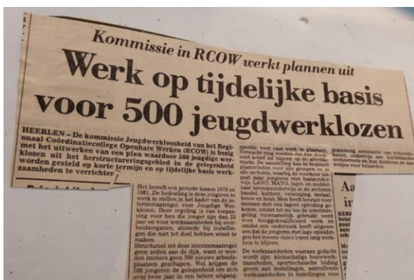
Krantenknipsel jeugdwerkloosheid 27-03-1979 90