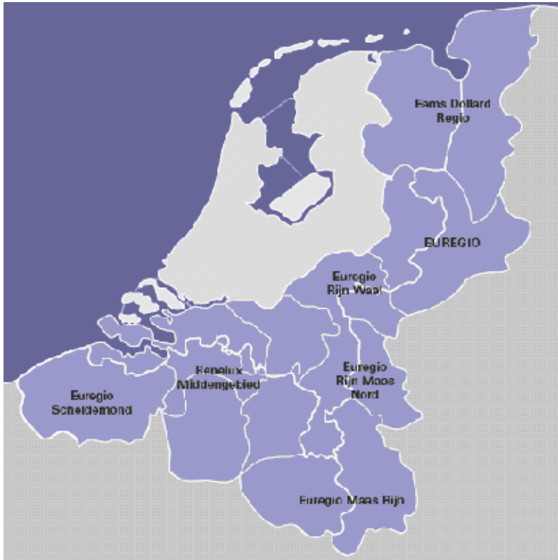
Figuur 1. De Nederlands/Duits/Belgische euregio's 41

Alvorens dieper in te gaan op (het functioneren van) de zeven euregio's die Nederland rijk is 42 , wordt in dit hoofdstuk het gehele palet geschetst van de wijze waarop grensoverschrijdende bestuurlijke samenwerking gestalte kan krijgen.