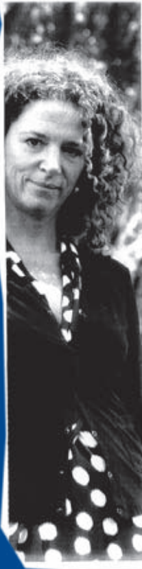
Wie heeft er nu de baas?

Advies: meer bemoeienis van Tweede Kamer met de Raad voor het Openbaar Bestuur gisteren gepubliceerd.