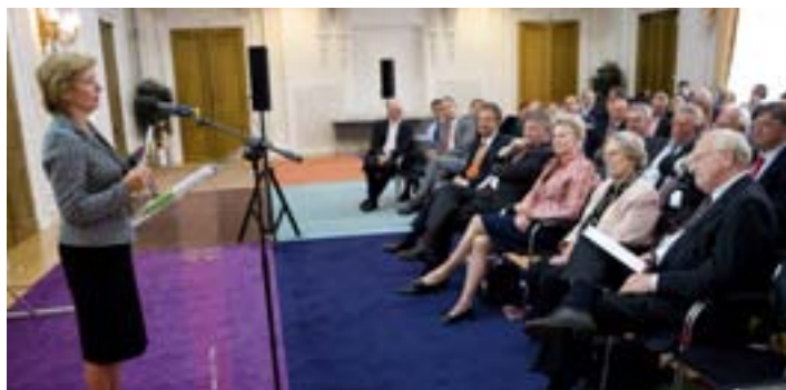
Minister Ter Horst spreekt Jos van Kemenade toe tijdens zijn afscheidssymposium 'Het wegen van publieke waarden' op 18 juni 2009