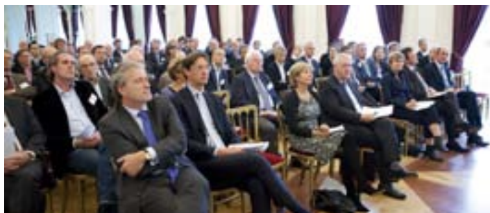
Bestuurders en ambtenaren tijdens het symposium 'Meer eenheid in het regeringsbeleid?' op 4 november 2009

Ongeveer honderd mensen bezochten op 4 november 2009 het symposium in de Oude Raadzaal 'Meer eenheid in het regeringsbeleid?', georganiseerd door de Raad voor het openbaar bestuur en het ministerie van BZK. Jacques Wallage, voorzitter van de Raad voor het openbaar bestuur, ging in op de voordelen van een kernkabinet. Minister Ter Horst nam het boek 'Naar een collegiaal en samenhangend overheidsbestuur; de lokale bestuurspraktijk als wenkend perspectief voor het rijk?' in ontvangst. Het boek is verkrijgbaar in de boekhandel (ISBN 9789012132459) of via uitgever SDU.