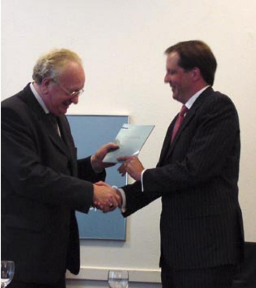
Aanbieding van het advies aan minister Pechtold