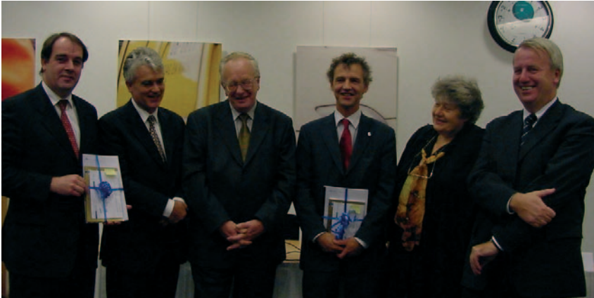
Aanbieding van het advies GSB aan minister Van Boxtel en wethouder Verkerk uit Den Haag.

De centrale probleemstelling in dit advies luidt: in hoeverre bereiken de betrokken actoren de bestuurlijke doelstellingen – decentraal, integraal en resultaatgericht – van het GSB? Vanuit deze vraagstelling stellen de Raden in dit advies het sturingsconcept van het GSB centraal. De bestuurlijke vormgeving van het GSB is volgens de Raden samen te vatten met drie sleutelbegrippen: decentraal, integraal en resultaatgericht. Deze sturingsconcepten sluiten nauw aan bij andere bestuurlijke ontwikkelingen en theorievorming over het openbaar bestuur. Een onderscheid dat de Raden bij de analyse hanteren is dat tussen Rijk en steden. Binnen de bestuurlijke vormgeving is een bepaalde methode van werken (interactief, partnerschap, vrijwillige doch niet vrijblijvende samenwerking en verticale en horizontale coördinatie) kenmerkend voor de ‘GSB-aanpak’.