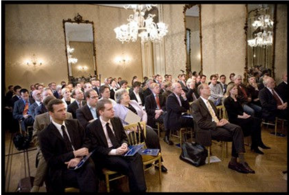
Foto 1: Het symposium '10 jaar Financiële-verhoudingswet' op 31 oktober 2007